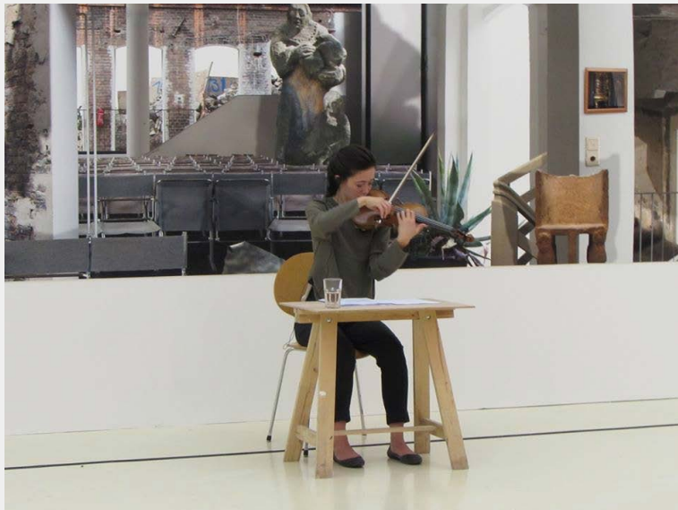
הכמוס הגמור בגלוי, פרפורמנס מוזיקאלי-טקסטואלי